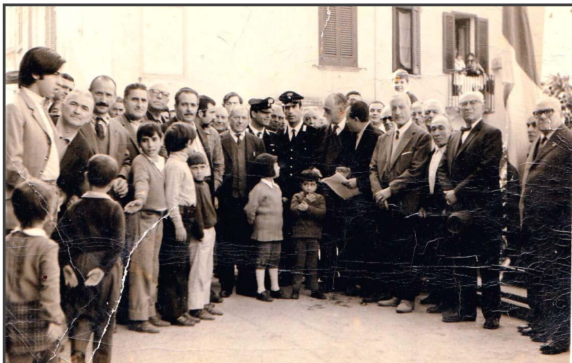
Raduno Reduci di Guerra 1915-18 di Lago: 4 novembre 1971