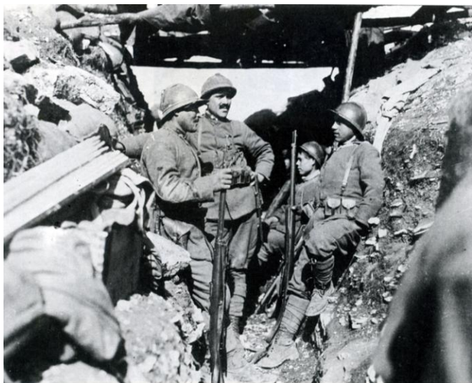
Trincea italiana sul Piave nel 1918

Anche il 219° Reggimento di Fanteria che, pur avendo come centro di mobilitazione la città di Salerno, attirava molti calabresi. Incuranti di queste situazioni, i mass media influenzati dal governo, creavano il mito della guerra e dell'eroico gesto del giovane italiano che s'immolava per il bene della Patria. Veniva taciuto lo squallido orrore delle trincee e le nostre perdite erano minimizzate. La propaganda cercava anche di incoraggiare i nostri emigranti specialmente negli USA, a ritornare in Italia per combattere in nome della Patria.